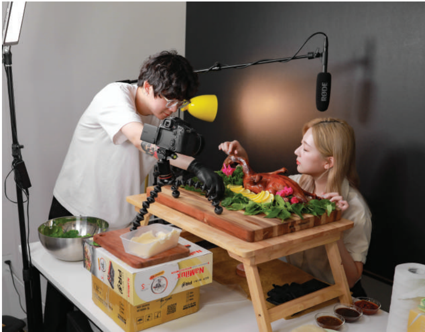
Mukbang filming in studio